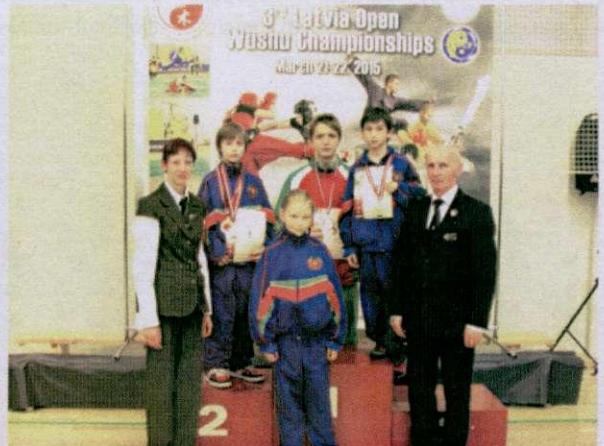
Сборная команда БГУФК по у-шу