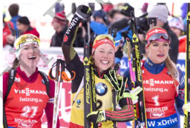
Дарья Домрачева, Лаура Дальмайер, Габриэла Коукалова

Домрачева стартовала лишь 27-й, уступая почти полторы минуты победительнице спринта – чешке Габриэле Коукаловой.