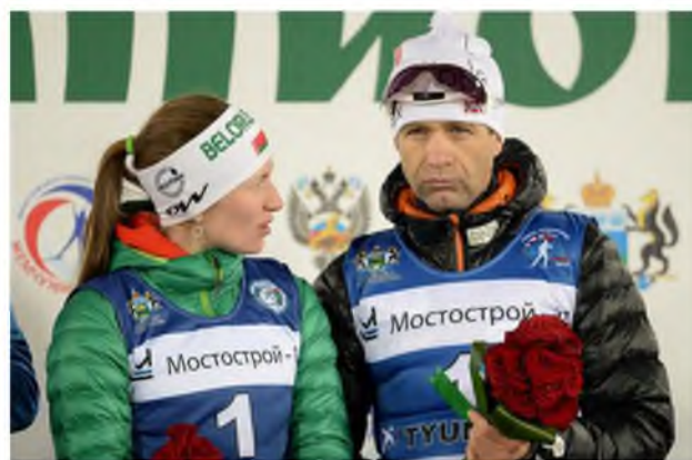
Дарья Домрачева и Уле-Эйнар Бьорндален