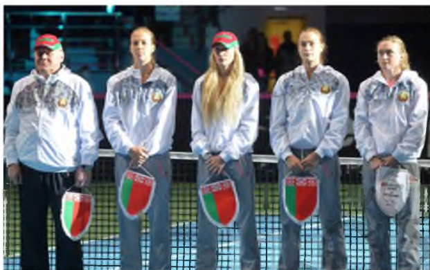
Женская сборная Беларуси по теннису

Следом победный почин поддержали и наши девушки в Кубке Федерации. И напрасными были переживания по поводу не выхода на корт Виктории Азаренко, которая стала мамой. Девчата справились и без лидера.