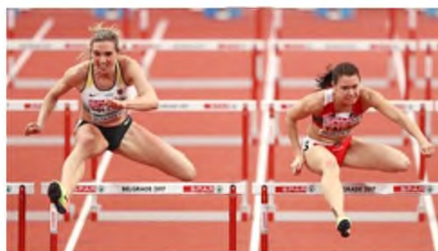
Синди Роледер и Алина Талай.

В решающем забеге белоруска пробежала спринтерскую дистанцию за 7,92 с. Чемпионкой стала немка Синди Роледер – 7,88 с. Бронзовую награду завоевала Паулина Дуткевич из Германии – 7,95 с. Две немецкие бегуни были основными конкурентками белоруски в ходе зимнего легкоатлетического сезона. К примеру, на турнире в Дюссельдорфе в середине