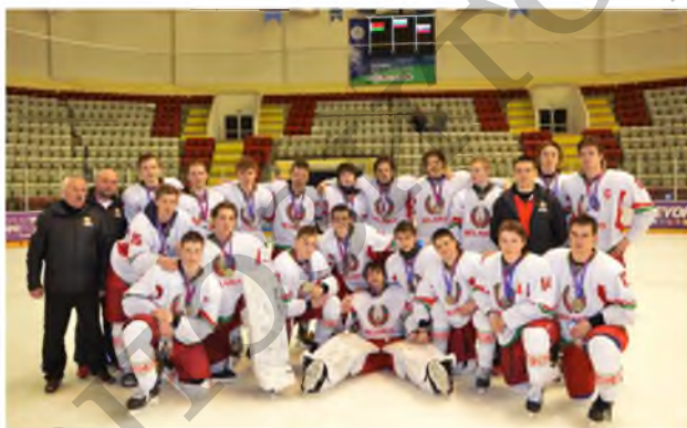
Сборная Беларуси по хоккею U-17

В решающем противостоянии сильнее оказались россияне – 7:1.