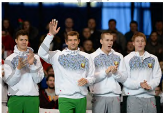
Мужская сборная Беларуси по теннису