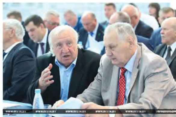
Олимпийские чемпионы Валерий Шарип и Александр Медведь

На Олимпийском собрании обсуждены вопросы внесения изменений и дополнений в Устав НОК Беларуси, рассмотрен отчет ревизионной комиссии о деятельности Национального олимпийского комитета за период 2013–2016 годов.