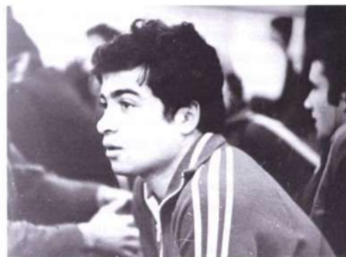
Вадим Биндлер — чемпион СССР

Вадик Биндлер пришел с сестрой-близнецом — мне вообще везло на близнецов: одновременно тренировались 10 пар. Сестру я сразу отправил в соседнюю комнату... рисовать. Она была вся из себя симпатичная, но не хотела заниматься. Это я понял сразу. А Вадик упорный, дисциплинированный, но «деревянный». Я подумал: ну и пусть, не будем мы с ним шпагаты делать, да и для прыжковой