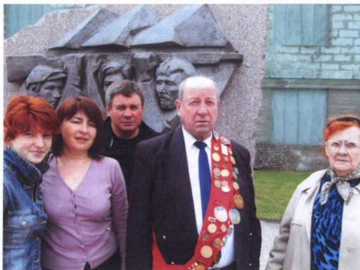
9 мая вся семья собирается на месте казни отца

Я учился в школе № 1, которая находится на улице Чкалова напротив гостиницы «Спутник». Там был кружок гимнастики, который вел маленький и сухонький преподаватель. Все его называли Доход Петрович, от слова «доходяга». Мы с братом приходили на занятия и делали незамысловатую гимнастику: кувырки, мостики, шпагаты, колеса и разные стойки на голове да на руках. В 1953 году, когда я учился в 6-м классе, меня попросили выступить на городских со-