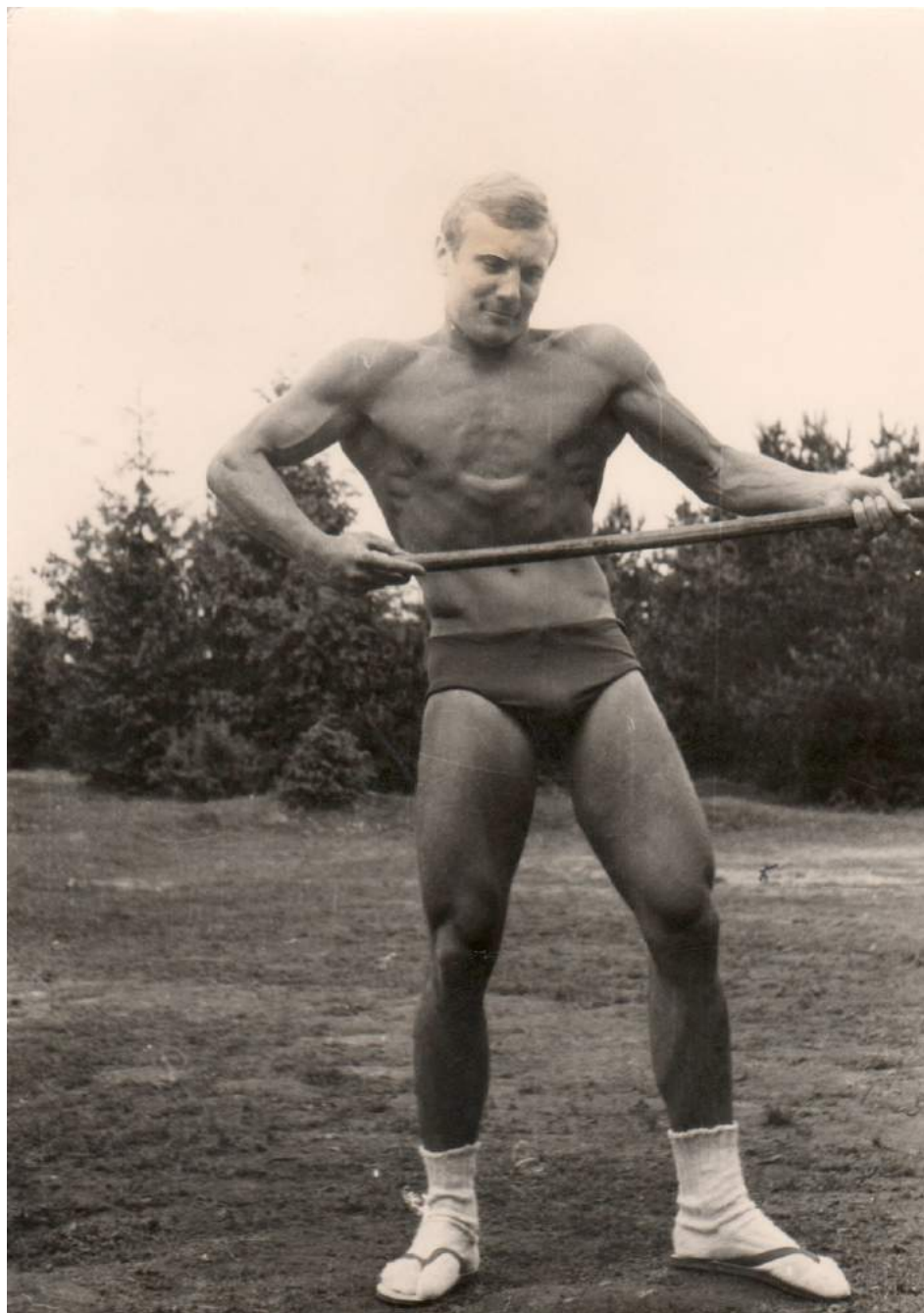
1966 – Уручье, первый год работы тренером сборной команды 7 СКА КБВО