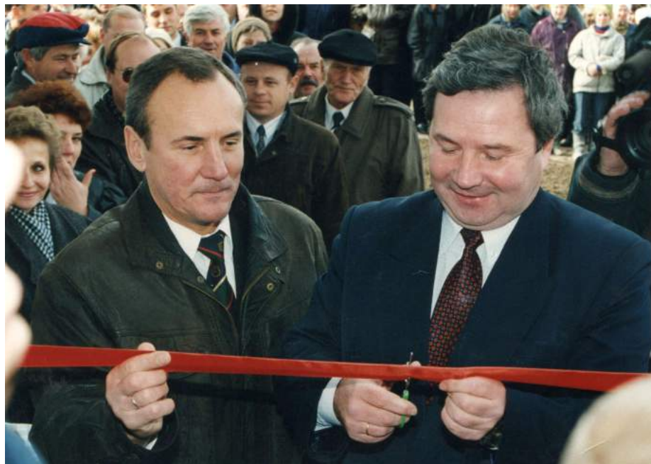
Открытие спортивного зала с заместителем Министра спорта и туризма А. В. Григоровым