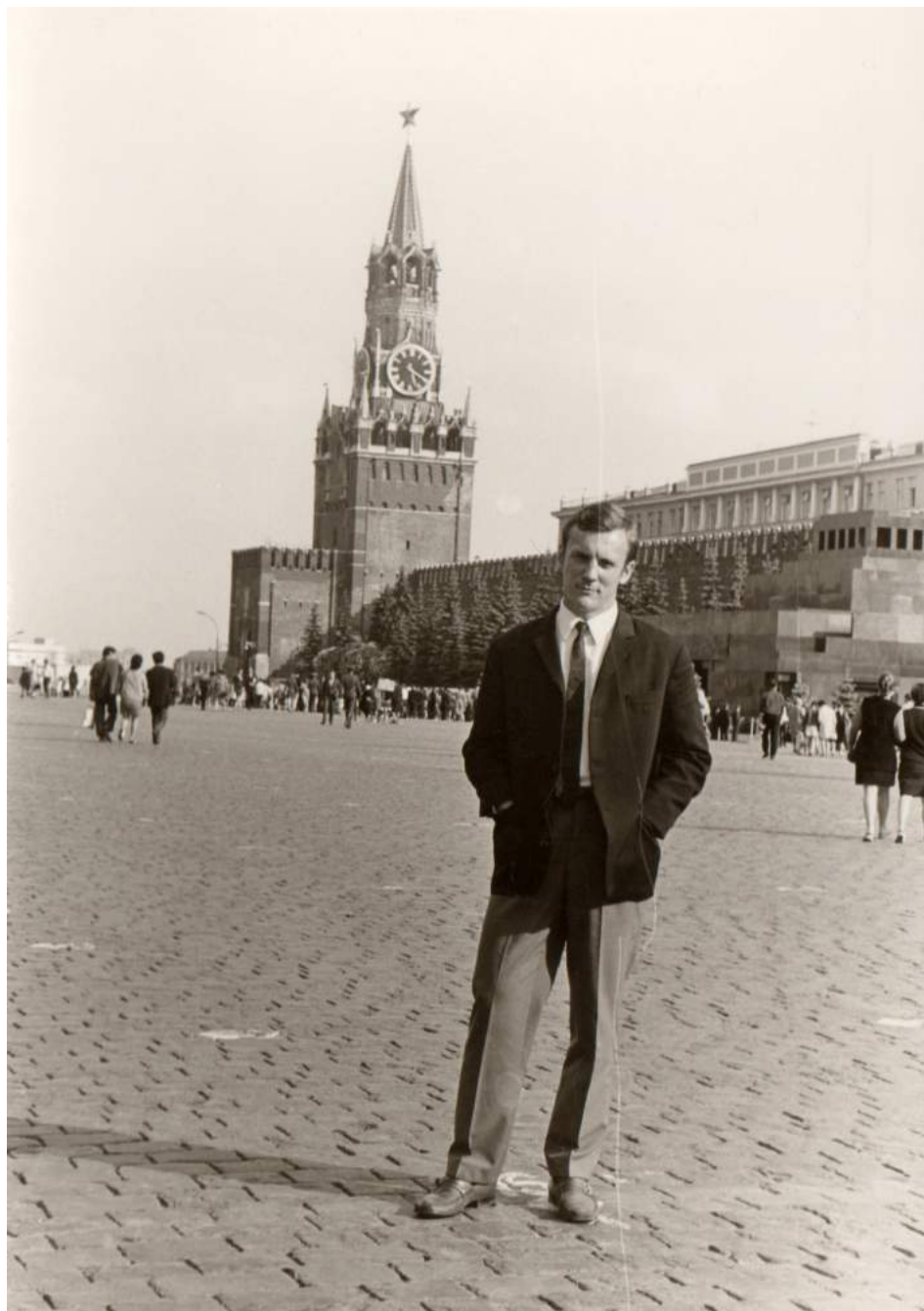
Период учебы в аспирантуре ГЦОЛИФК (1970–1973)