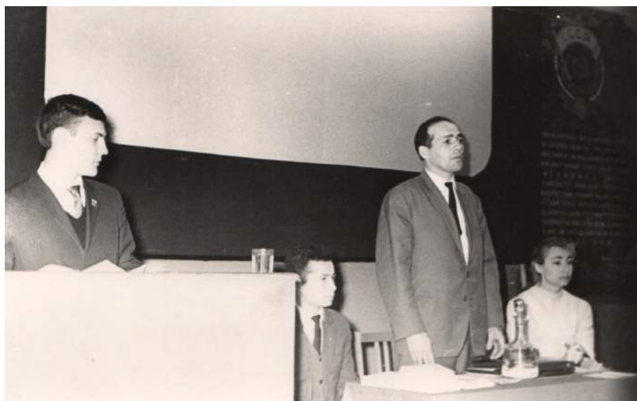
Студенческая научная конференция, 1964