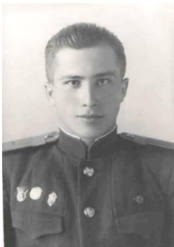
Выпускник спецшколы ВВС (1951)