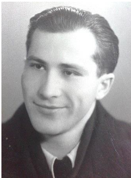
Молодые супруги (1956)