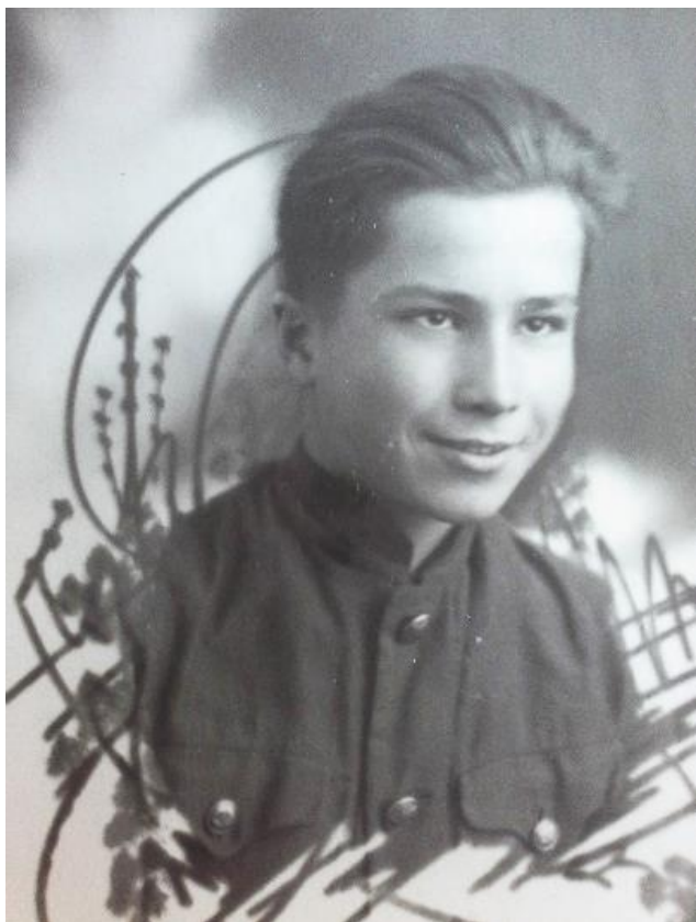
Ученик ремесленного училища (1946 г.)