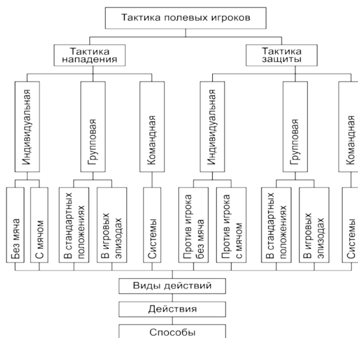
Рисунок 2 – Классификация тактики полевого игрока

Элементы тактики: тактический план и способы его осуществления в зависимости от конкретного соперника и своих возможностей; изменение тактики; конкретные способы решения возникающих задач (приемы психологического воздействия на соперника, маскировка возможных действий и др.).