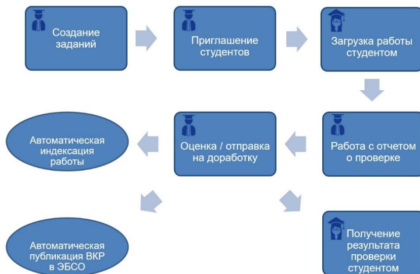
Рис. 1. Алгоритм взаимодействия преподавателя и студента.

Этап 1. Создание заданий. «Преподаватель» в разделе «Управление курсами» создает курс и задания. При этом он ограничивает дату сдачи работы «Студентом» и количество попыток (от 1 до 5), выбирает шкалу оценок, может предоставить «Студенту» доступ к краткому отчету, настроить автоматическое размещение ВКР в ЭБСО 3 .