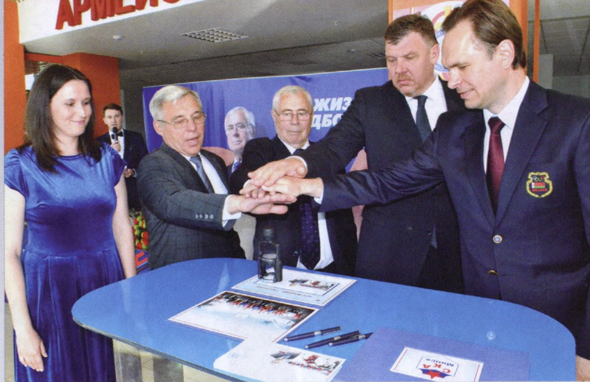
Гашение именного конверта