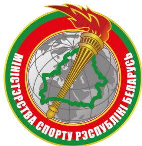
Министерство спорта Республики Беларусь